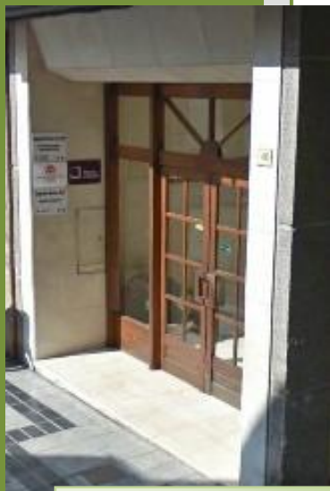
Entrada de la seu de la Demarcació de Tortosa

Es va acordar crear un grup de treball encarregat d'estudiar a fons les conseqüències jurídiques i econòmiques d'una eventual desvinculació del Col·legi envers el Consejo , i establir possibles propostes alternatives.