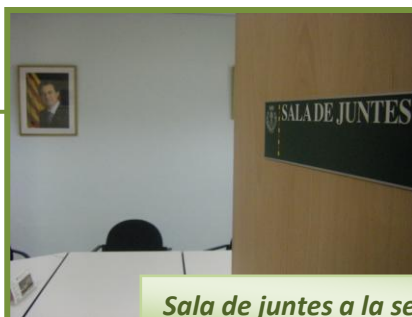
Sala de juntes a la seu del COETAPAC

També es va dur a terme a la demarcació de Lleida una Junta de Govern monogràfica amb totes les Juntes de Govern de les diferents demarcacions, on es va tractar la situació i estructura actual del Col·legi i possibles propostes de modificació.